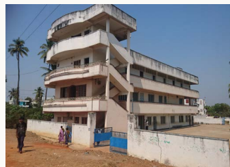
Gebouw van Crosspoint Ministries