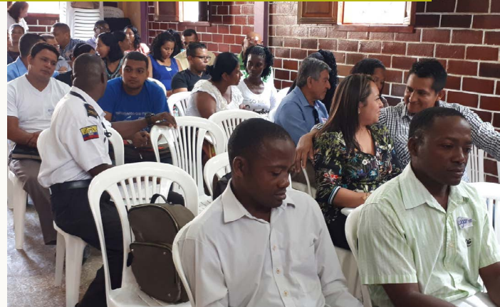
Deelnemers conferentie in Esmeraldas