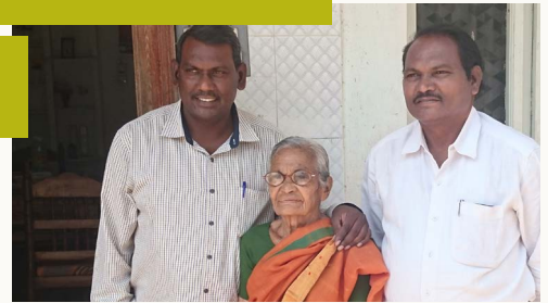
Mevrouw Raju met twee zoons