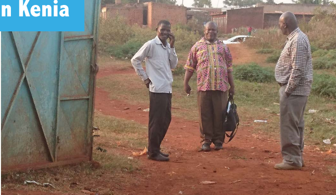
Deelnemers conferentie in Kenia